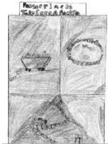
Cydradd ail: Caitlin Tocker, Ysgol Talysarn